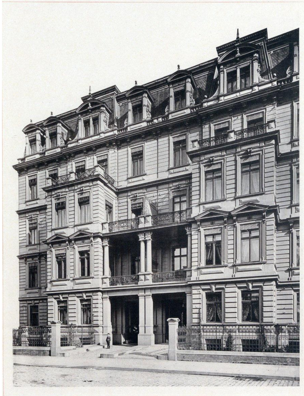
F. Kooh Architekt