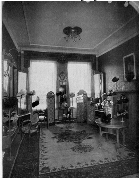
Abteilung für Damenhüte und Putz.

F. KOSTERLITZ, INH.: VICTOR KRAUSE BERLIN W., BELLEVUE STR. 7. Früher Molren Strasse 2 Damenhüte und Putz, fertige Damen-Konfektion Modsalon für Maassanfertigung ∴ ∴ ∴ ∴